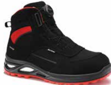
Boa® Fit system