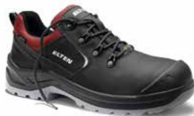
Breathable & waterproof