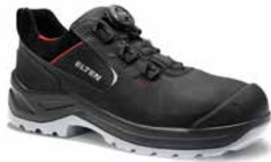
BOA® Fit System