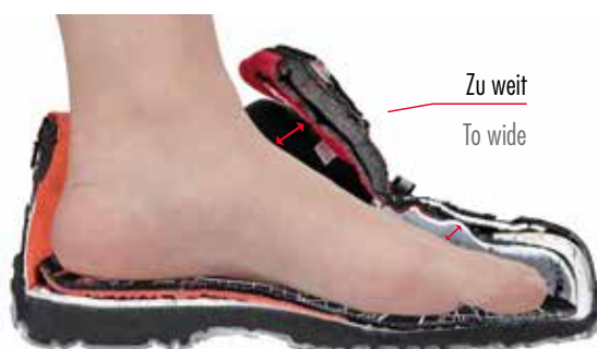
Ein Damenfuß in einem Herrenschuh A ladies' foot in a men's shoe