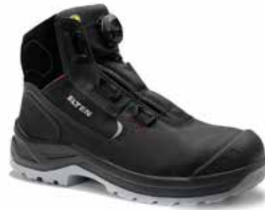
BOA® Fit System