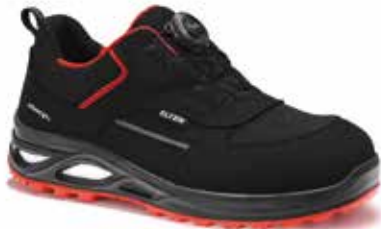
Boa® Fit system