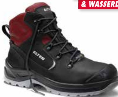
Breathable & waterproof